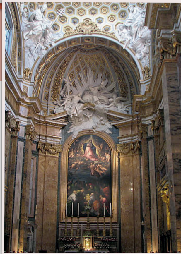
Eglise "Saint Louis des français »

Il existe à Rome un ensemble exceptionnel de tableaux peints par le célèbre peintre le Caravage. Ces tableaux se trouvent dans des églises, des musées ou des palais. Dans l'église de Saint Augustin (Chiesa San Augustino) se trouve "La madone des pèlerins". Le Caravage a pris Lena, sa maîtresse, comme modèle de la Madone, une Madone tout en mouvement.