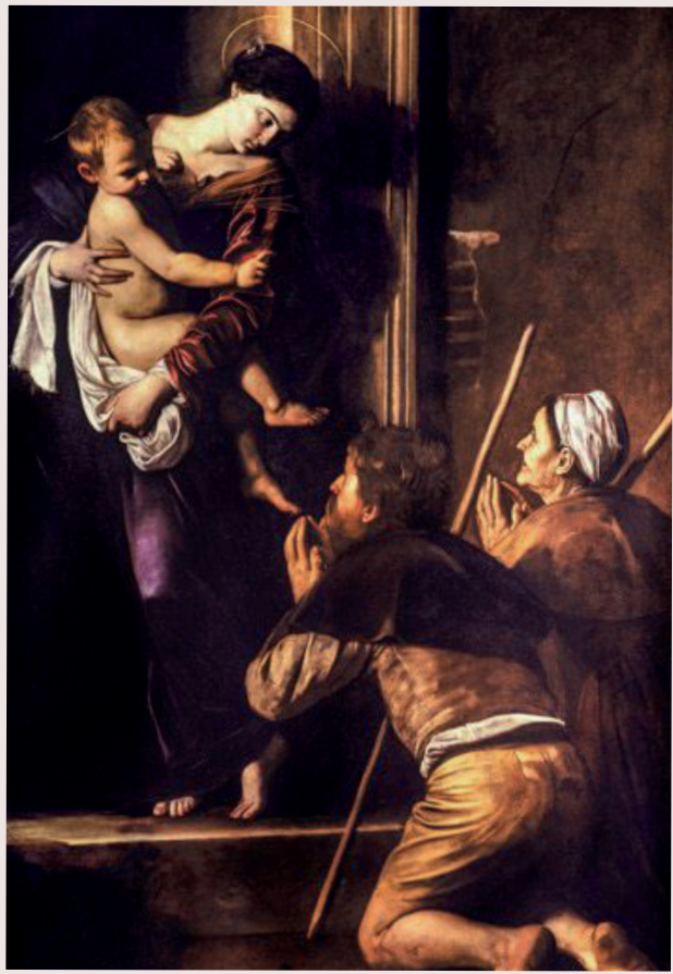
Eglise « Sant Agustino »

Il existe à Rome un ensemble exceptionnel de tableaux peints par le célèbre peintre le Caravage. Ces tableaux se trouvent dans des églises, des musées ou des palais. Dans l'église de Saint Augustin (Chiesa San Augustino) se trouve "La madone des pèlerins". Le Caravage a pris Lena, sa maîtresse, comme modèle de la Madone, une Madone tout en mouvement.